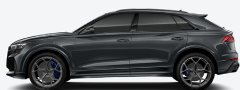
Daytona grey, pearl effect (6Y6Y)