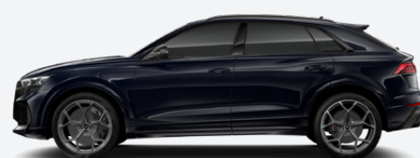
Night blue, pearl effect (Q0Q0)