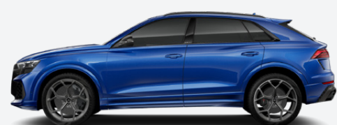
Sepang blue, metallic (Q0Q0)