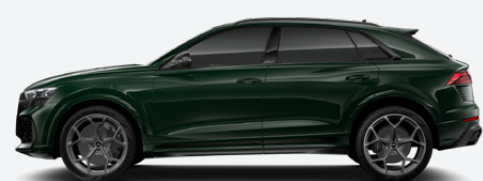
Goodwood green, pearl effect (Q0Q0)