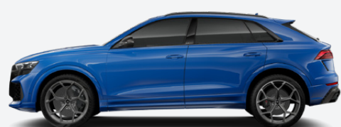
Nogaro blue, pearl effect (Q0Q0)