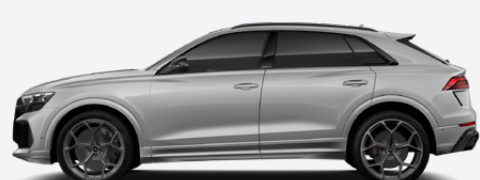
Suzuka grey, metallic (Q0Q0)