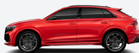
Misano red, metallic (Q0Q0)