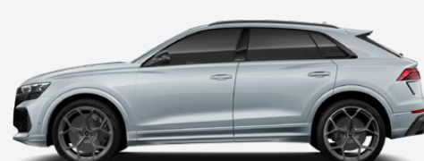
Arrow grey, metallic (Q0Q0)