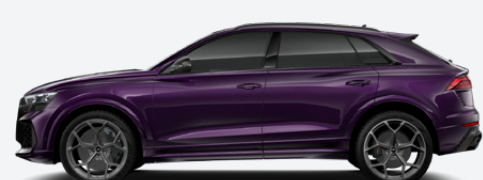
Merlin, pearl effect (Q0Q0)