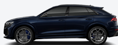
Waitomo blue, metallic (D6D6)