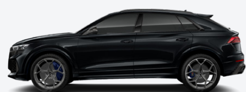
Mythos black, metallic (0E0E)