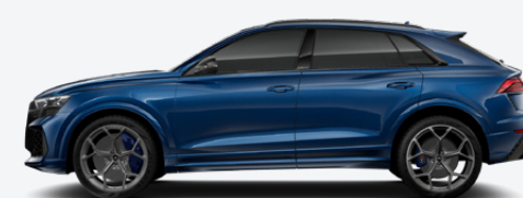
Ascari blue, metallic (9W9W)