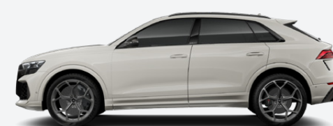
Siam beige, metallic (Q0Q0)