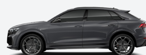
Nimbus grey, pearl effect (Q0Q0)