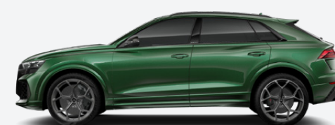
Avocado green, pearl effect (Q0Q0)