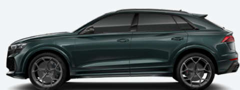
Camouflage green, metallic (Q0Q0)